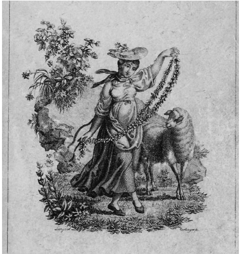
Alpenrosen 1818 – Rückseite Einband Schäferin (Rokoko-Motiv)

von Touristen an die bekanntesten Orte in den Schweizer Bergen. Erstaunlich, was im selben Jahrgang 1813 August Wilhelm Schlegel,