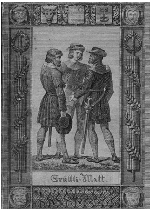
Alpenrosen 1827 – Einband Vorderseite

Wer es sich leisten konnte, Adlige und reiche Bürger, reiste in die Berge; bereits im frühen 19. Jahrhundert strömte eine Welle